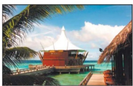
Das »Lighthouse« punktet auch mit seiner außergewöhnlichen Architektur.