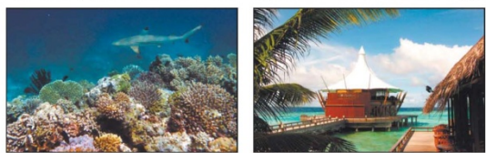
Ein Schwarzsippenhai erkundet das Riff der Malediven-Insel Baros.