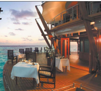
Alles ist vorbereitet für ein Dinner am Meer – im »Lighthouse« auf Baros erleben Gäste das Beste, was die Malediven zu bieten haben.

Gepflegte Entschleunigung beim Urlaub auf den Malediven