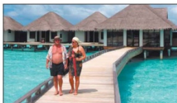
Das neue Spa auf Velassaru ist über einen Steg mit der Insel verbunden.

Weil Gäste in der Regel eher selten einen Ausflug in die weniger sehenswerte Hauptinsel Male unternehmen, möchte Blitz auf Baros eine Museums-Lounge einrichten, die das Lokalkolorit erhellend erholt. »Das sparen