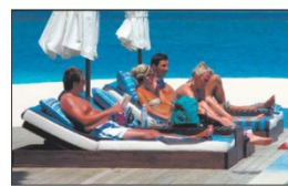
Trotz Traumstrand: Für viele Urlauber gehört Entspannen am Pool einfach dazu.