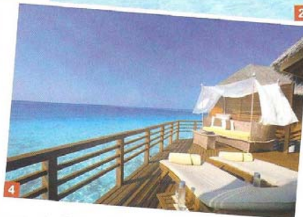
1. Von den Restaurants gleitet der Blick direkt auf die Lagune 2. Tropische Idylle am goldenen Strand 3. Die Poolvillen sind luxuriös ausgestattet 4. Blick von der Terrasse einer Wasservilla